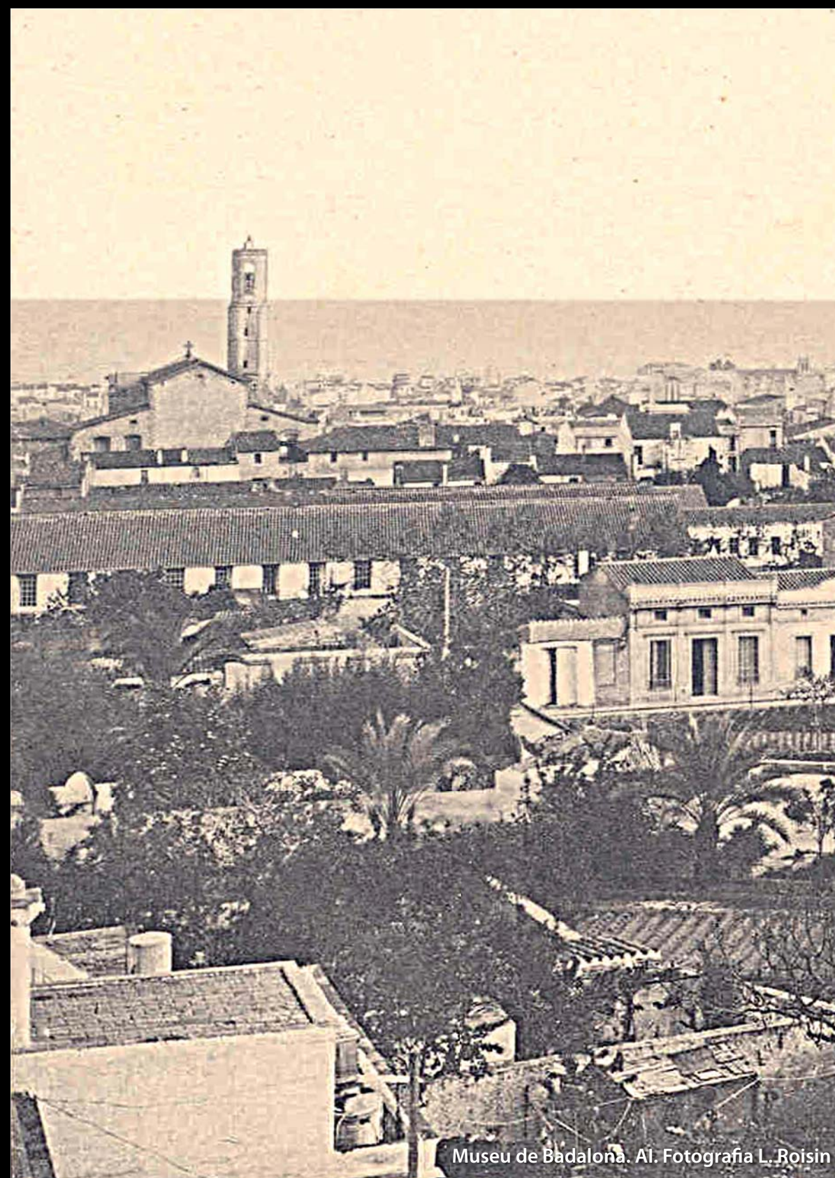
Museu de Badalona. A1.

Quan es van demolir les naus, el Museu de Badalona va fer una intervenció arqueològica al solar, que va posar al descobert un conjunt de restes arquitectòniques i de materials d'època romana. Les restes es van protegir abans de començar la urbanització, que va donar lloc a la plaça de la Ciutat Romana, i els materials es van portar al Museu, on es conserven degudament catalogats.