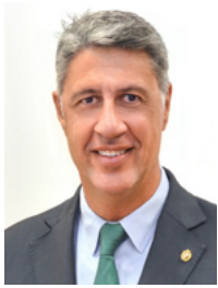
Xavier Garcia Albiol Alcalde de Badalona Mayor of Badalona

Badalona és una gran ciutat, amb atractius tan innegables com la seva façana marítima o el seu llegat arqueològic i amb barris diversos, que vibren amb l'activitat dels eixos comercials, els mercats, les botigues, els bars i els restaurants. Teniu entre les mans una guia amb la qual volem donar-vos a conèixer aquesta gran varietat d'experiències i possibilitats que els veïns –i també els visitants– podeu trobar a Badalona.