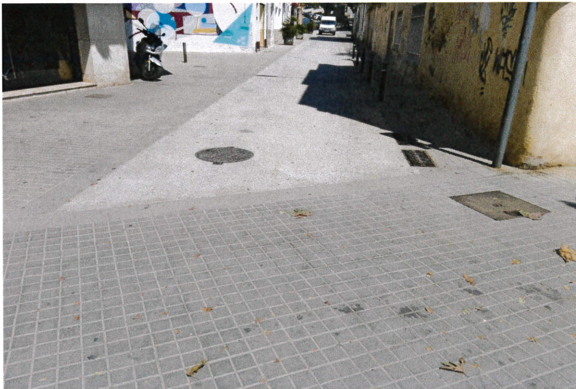
Vista del carrer Seu d'Urgell