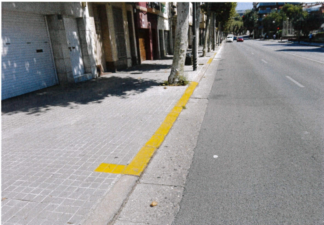
Vista del tram del carrer Sant Bru abans d'arribar al tram ja reparat