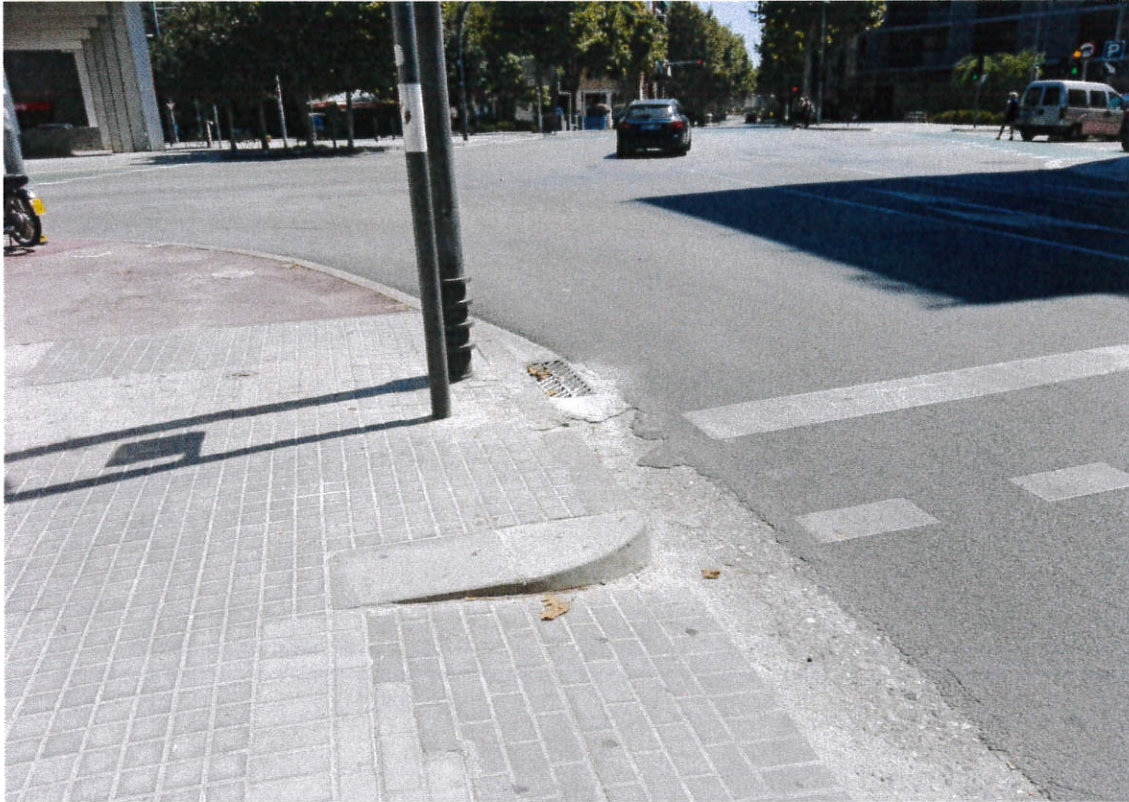
Cruïlla del carrer Sant Bru amb la Riera Canyonó