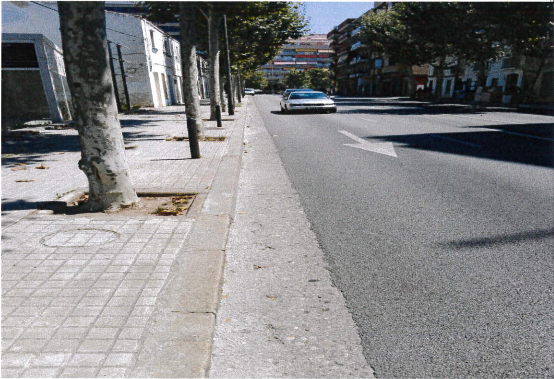
Vista del carrer Sant Bru en el tram entre l'accés al parc de cal Arnús i la Riera Canyonó.