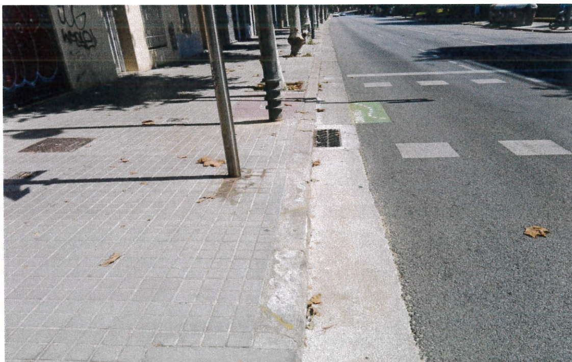
Vista del carrer Sant Bru junt al carrer Seu d'Urgell

UR, S.A. el Regidre l'Ido Bar' um 754f 4, Secció 2, Full 8C 1000 1a N 7725