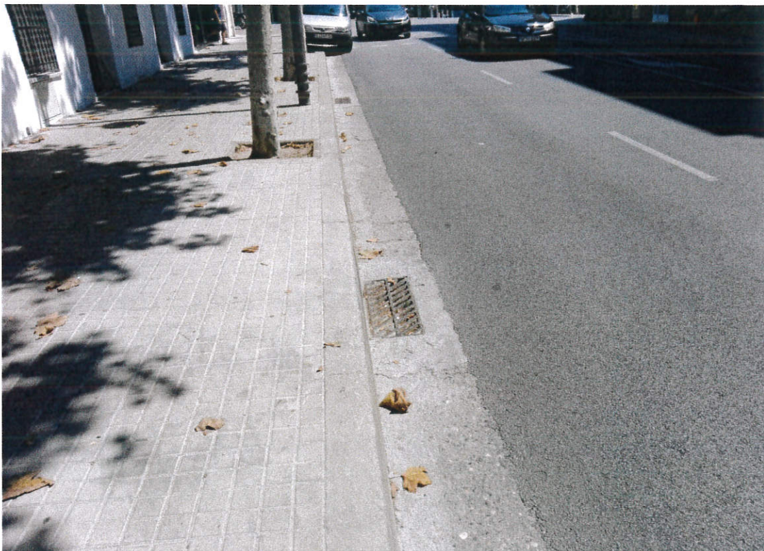
Vista del carrer Sant Bru prop de la Riera Canyonó