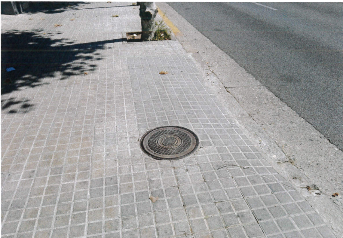
Tapa de clavegueram en vorera

UR, S.A. | el Registre | tili de Bar | um 754E | 4, Secol | 2, Fulli BE | 360, 1a N | 7725