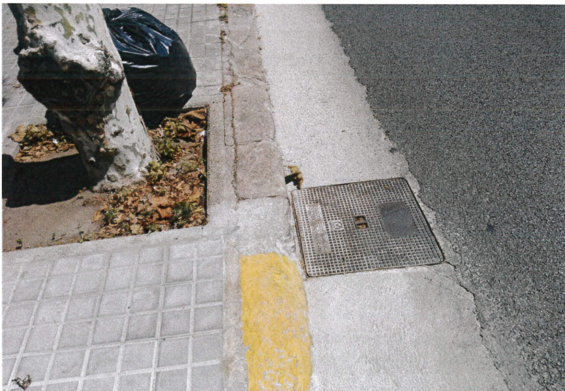
Arqueta en el tram ja reparat