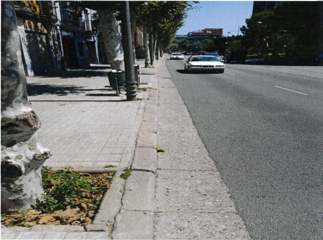
Vista del carrer Sant Bru en el tram entremig entre el carrer Seu d'Urgell i Triomf