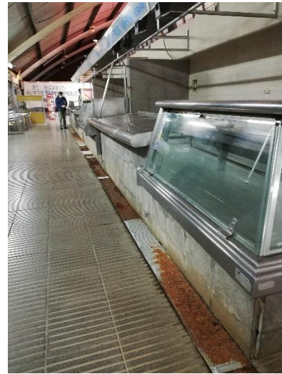
Illa a enderrocar i canal existent